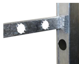
Montage bij wandplaatdikte 25 mm.