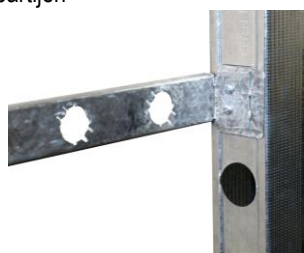
Montage bij wandplaatdikte 12,5 mm.